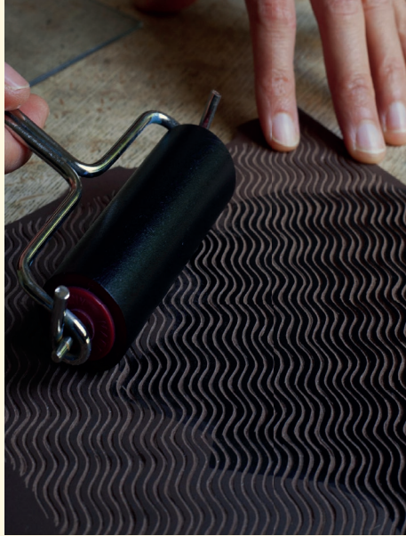
DA illustration, Linogravure Ewa Medrek