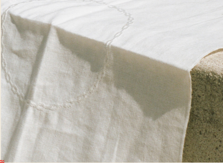
Broderie sur serviette